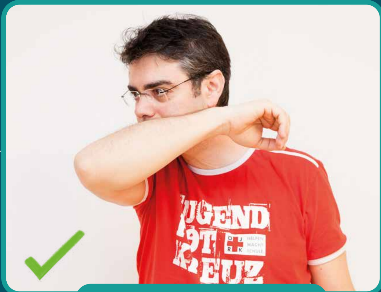
in die Armbeuge husten/niesen