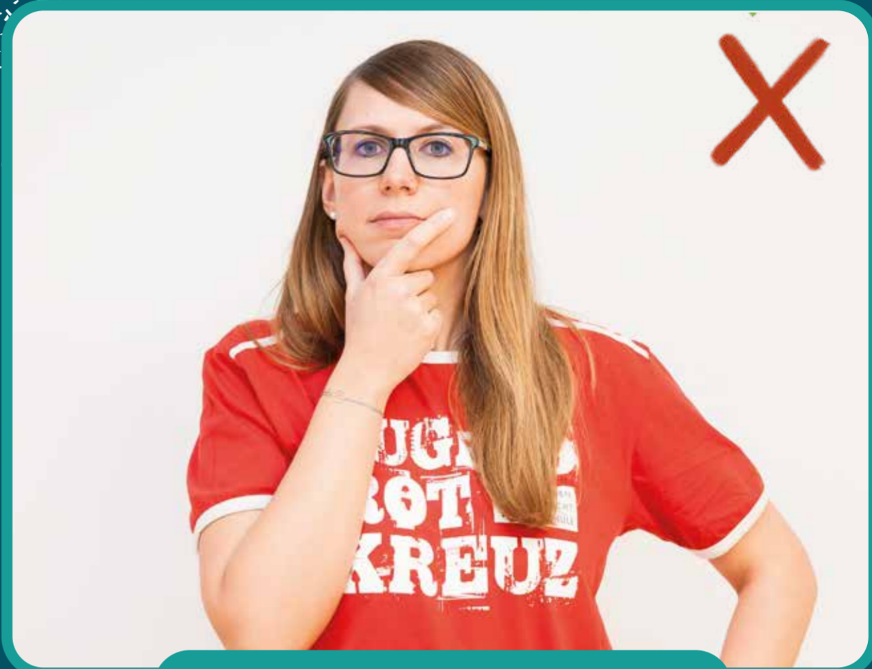
nicht ins Gesicht greifen