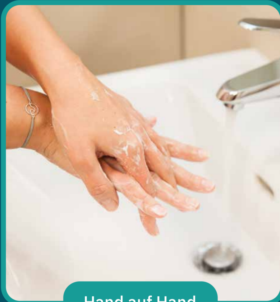
Hand auf Hand