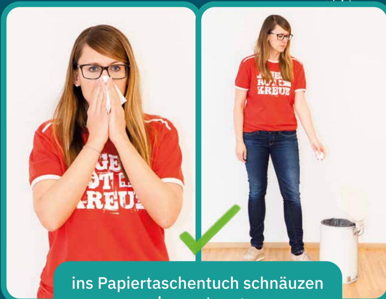
ins Papiertaschentuch schnäuzen und es entsorgen