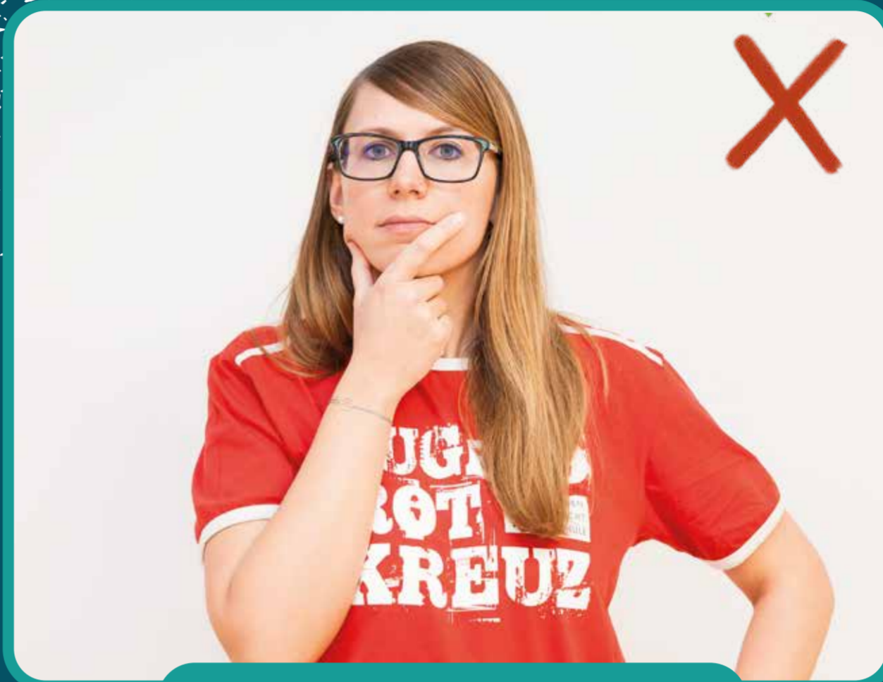
nicht ins Gesicht greifen