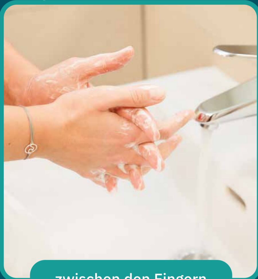
zwischen den Fingern